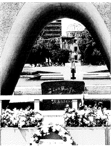
三日目には「平和祈念式典」に参加しました。

原爆資料館では、原爆が落ちる前と後の原爆ドーム付近の様子が表示されており、尊い命が奪われ、被害が広範囲に渡ったことを物語っており胸が苦しくなりました。